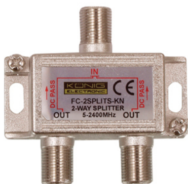
Coupleur / répartitionneur 3dB

La modification d'une installation d'antenne extérieure est très simple. Avant tout chose il faut se renseigner sur le site du CSA pour connaître la répartition des canaux pour l'émetteur à recevoir. Puis il suffit de remplacer le coupleur d'antenne à filtre de bande par un coupleur large bande. Les répartitionneurs/ coupleurs 3dB à fiches F qui vont 40 à 2500 MHz conviennent très bien et ne coûtent que quelques Euros.