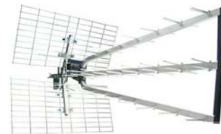
Antenne Yagi « trinappe »

Parmi les antennes commerciales on proscritra les panneaux plein ou antennes amplifiées : ils sont chers et ont une prise au vent élevée.